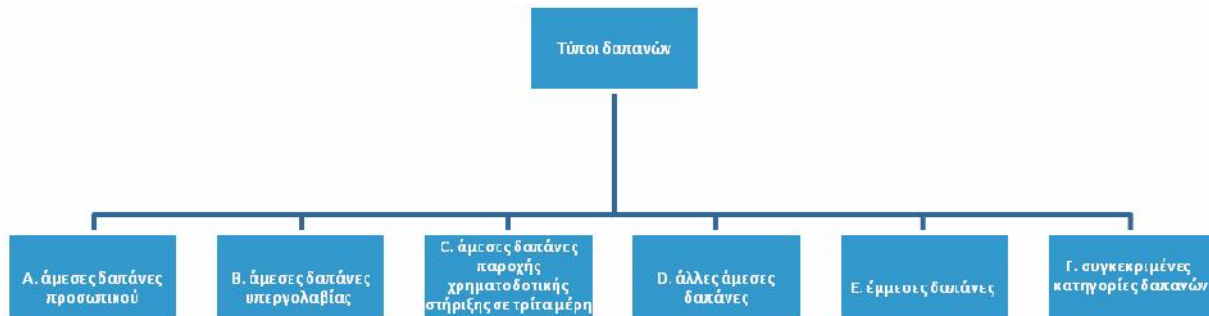
Σχήμα 3: Τύποι Δαπανών

ΣΗΜΕΙΩΣΗ: Στους τύπους δαπανών που αναλύονται κατωτέρω ακολουθείται η αρίθμηση της συμφωνίας επιχορήγησης (Α έως F)